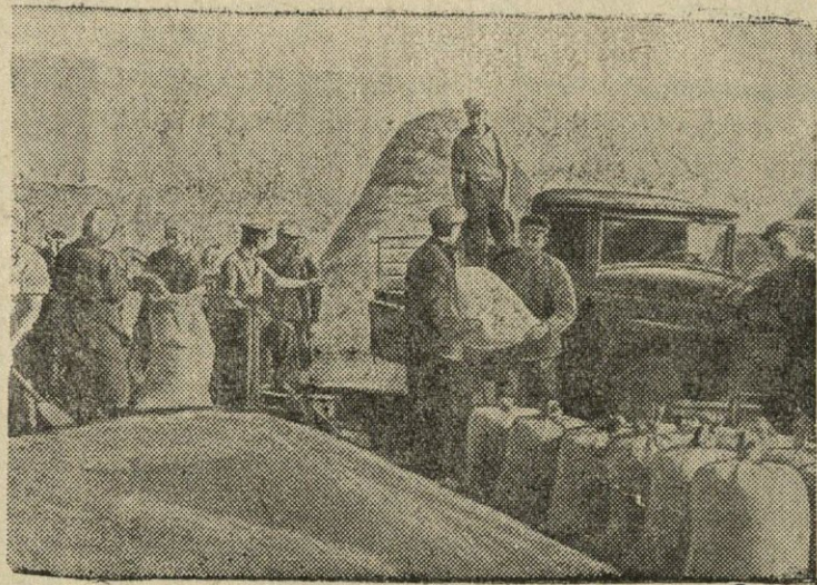
Kirovgrade sritis. Bobrinecke rajone, 13-je VKP(b) suvažiavime vardo kolektyvinis ūkis vienas iš pirmųjų aliko metinį grūdų paruošų planą. Virš plano jis valstybei davė gana didelius kiekus grūdų. Nuotraukoje: viršplaniniai grūdai paruošiami nugabenimui į elevatorius.