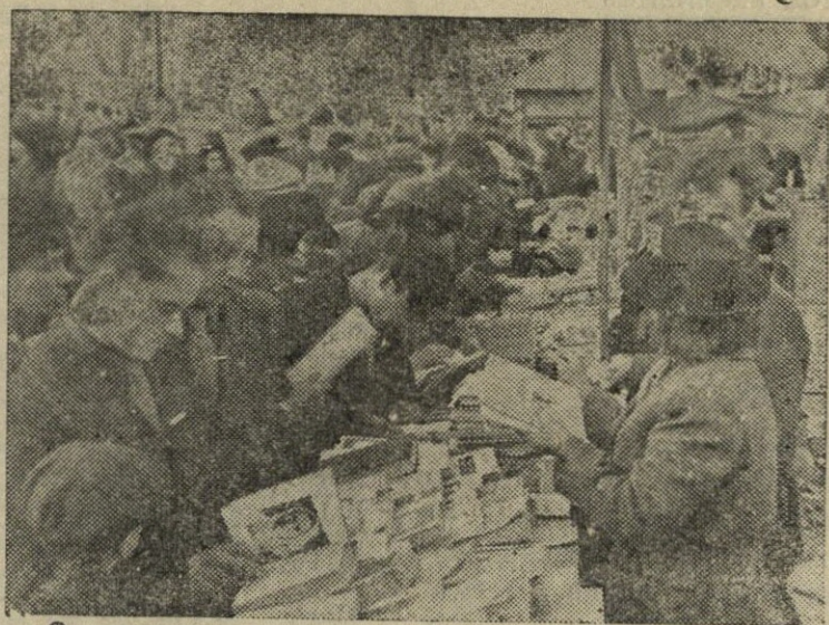
Sąryšyje su tarybinės knygos platinimo mėnesiu Lietuvoje Vilniaus mieste, Pilies aikštėje atidaryta didelė knygų mugė. Čia didelis knygų pasirinkimas iš visų mokslo, literatūros ir meno šakų. Nuotraukoje: Respublikinio Kogizo skyriaus knygų kioskas knygų mugėje

Pasak laikraščio, amerikiečių agentai svarbiausią dėmesį kiria kurdų giminėms dechbakri ir karopapai arti Ušnu miesto, kurios, pakvietus gimininių vadus į sostinę rudens manevrams, nepasiuntė į Teheraną savo atstovų. (ELTA).