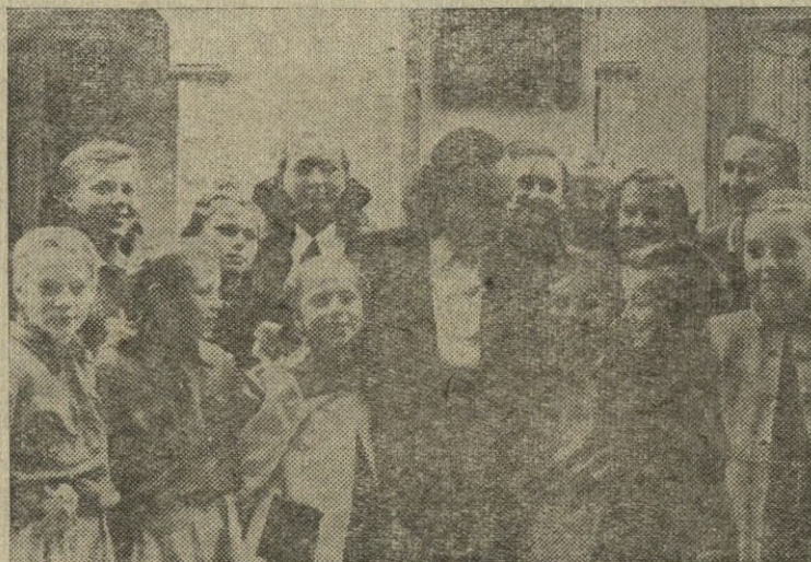
Rugsėjo mėn. 1 d. prasidėjo mokslas mokyklose.

Tad į darbą! Atstatome kraštą Iš granito iš rąstų pušinių — — — Mūsų darbo gigantišką mastą Šiandien laimina laisva tėvynė.