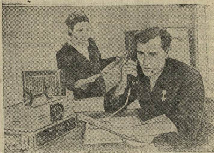
Šiais metais 43 Totorijos ATSR MTS įrengtas dispečerinis radio ryšis. Dirba virš 700 „Urožai“ tipo radioįrengimų. Dėl operatyvinio vadovavimo traktorių būriams vien tikrai Bujinsko MTS lauko stovyklose įrengė 17 radioįrengimų.

Visi veikiantieji progim- nazijos rateliai pilnu tempu pradėjo atlikinėti paskutines repeticijas, kad paskui galėtų savo darbo vaisius parodyti visuomenei. B. Lakmenis