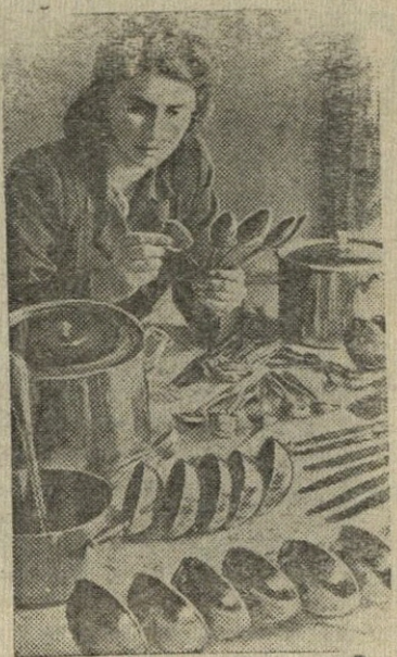
Maskvos gamyklos „Sierp i molot“ plataus vartojimo cechas gamina akininius indus iš nerūdijančio plieno atliekų. Čecho kolektyvas dirba viršymą planą.

*) A. Venclova, „Medis ir jo atžalos“. 300 psl., 1947 m. Valstyb. Grožinės Literatūros Leidykla. Kaina 9 Rb.