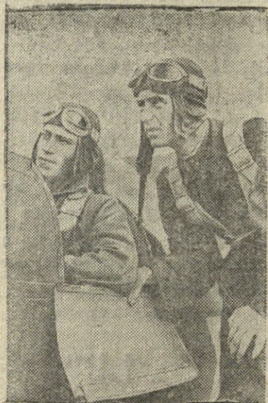
Astrachanė. Dešimtys jaunuolių ir merginų aerodromuose pasisavina skridimo meną.

Kupiškio Apskrityse Vykdomasis Komitetas