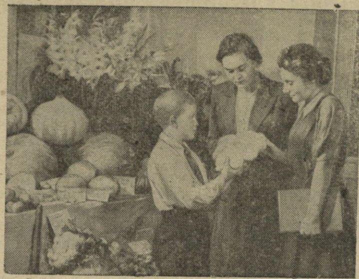
Neseniai Timiriazevsko rajone atsidarė gėlių ir sodų mėgėjų laimėjimų paroda.