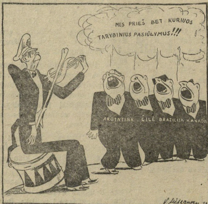
SNO Generalinėje Asamblėjoje Argentinos, Čilės, Brazilijos ir Kanados delegacijos klusniai vykdė JAV delegacijos nurodymus