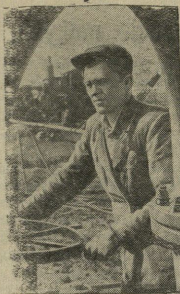
Kalinino sritis. Išsivysčiusiose priešspalinėse socialistinėse lenktynėse aktyviai dalyvauja durpių įmonės „Vasiljevskij mech“ kolektyvas.

PCHENJANAS, X. 16 d. (TASS). Pchenjano radijas skelbia, kad, pranešimu iš Pietų Korėjos, Taku miesto rajone, Šiaurės Kencando provincijoje, gyventojai sukilo prieš marionetinės „vyriausybės“ politiką. Tarp sukilėlių ir „vyriausybės“ kariuomenės prasidėjo įnirtingas mušis, kuris truko 30 minučių. Yra daug užmuštų ir sužeistų. Policija suėmė daug žmonių. (ELTA).