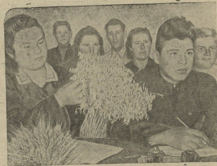
Tarybinio ūkio komjaunuoliai agrorušimimui.