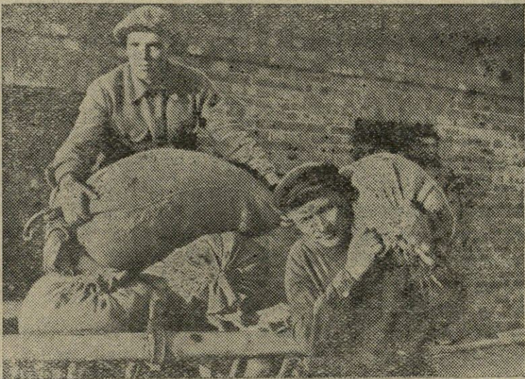
Įvykdes pirmąjį kolektyvinių ūkių priesaką — prieš laiką atsiskaitęs su valstybe grūdų paruošomis, Telšių apskrities „Vienybės“ kolektyvinis ūkis pradėjo išmokėti avansą grūdais kolektyvinių ūkio valstiečiams už atidribtus darbdienius. Jie gauna avansu po 10 kilogramų grūdų už darbdienį.

Rašytojai taip pat susitiko su Telšių gimnazijos moksleiviais.