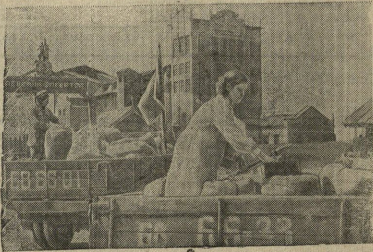
Baškirijos ATSR, Sajevisko elevatoriuje Alšiejevskio rajone. Kolektyvinio ūkio „Krasnaja Zvezda“ automašinos atvežė viršplaninę duoną.