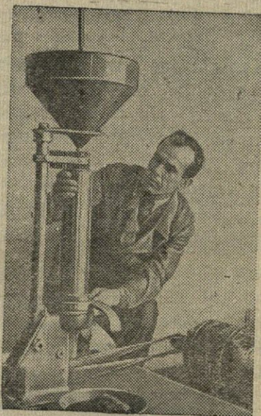
Jis kovoja už Stalininį penketį