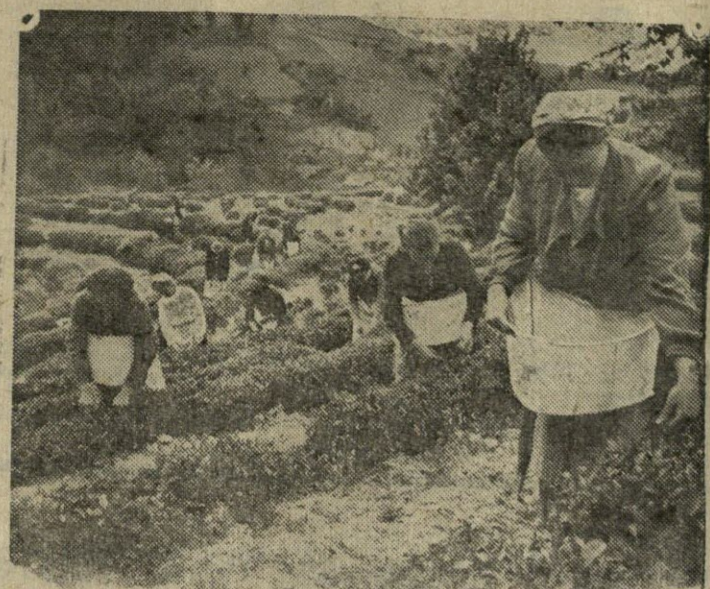
Rudens laukų darbai kolektyvinio ūkio [Laukuose vienoje brošiukų tarybinių respublikų