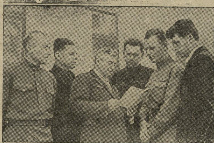
Dniepropetrovsko sritis: Praėjusiais metais Povlogrodsko rajono Viazimoko gyvenvietėje buvo suorganizuotas pirmas Ukrainoje kaimo lektoriumas.

Didysis rusų rašytojas Ivanas Sergiejevičius Turgenevas gimė 1818 m. Oriole bajorų šeimoje. Vaikystės metais jis labai mėgo gamtą. Jis mokėsi Maskvos ir Peterburgo universitetuose, kuriuose ir pradėjo savo litera-