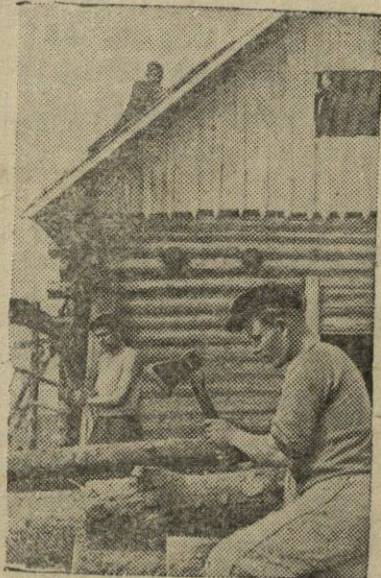
Maskvos sritis. Krasno — Poliansko rajono DVRA 13 metų vardo kolekt. ūkio grūdų sandėlio statyba.

nių namų kombinatas, sukurta statybinių detalių gamykla, plečia gamyklą siuvimo trikotažo fabrikas. Miesto pramonė dar gegužės mėnesį pasiekė prieškarinį produkcijos lygį ir tebespartina savo tempus.