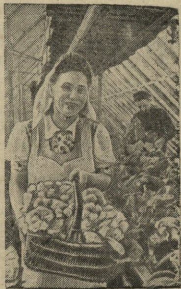
Ryga. Žydinčiųjų kopūstų pardavėjuje.