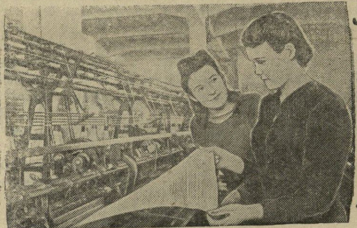
Kijevas. Rozos Liuksemburg vardo trikotažo fabrike.