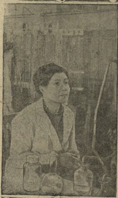
Saratovo analitinėje laboratorijoje.