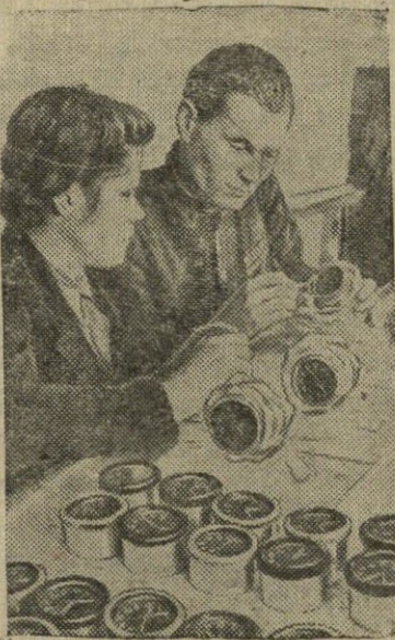
Čeliabinske pradėjo dirbti laikrodžių gamykla. Jau išleista pirmoji stalinių ir rankinių laikrodžių partija.