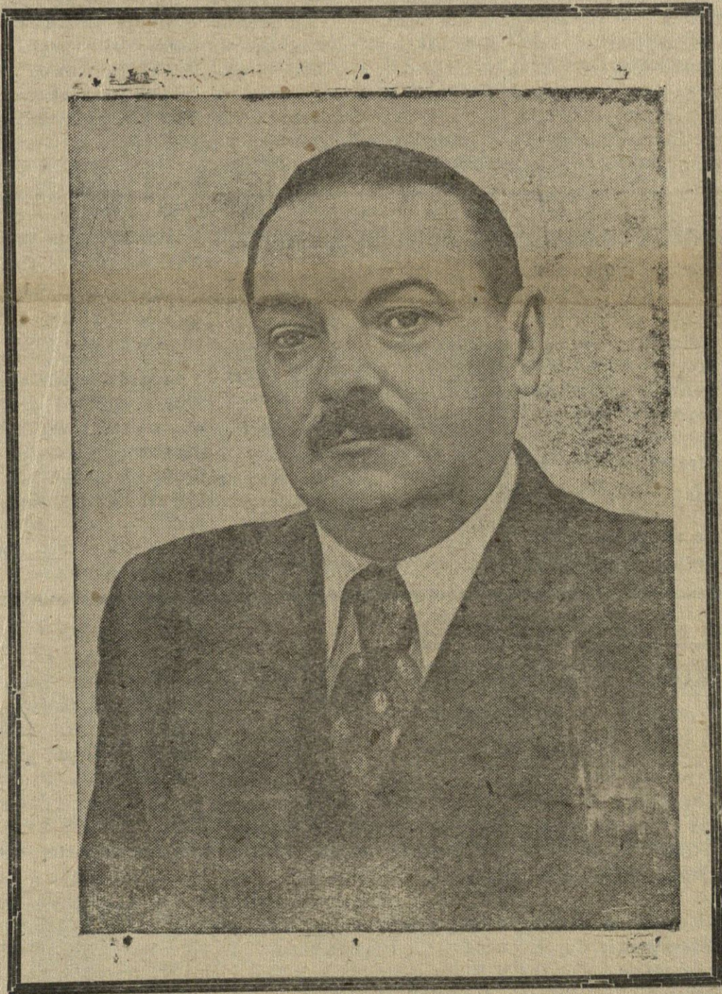
Andriejus Aleksandrovičius ŽDANOVAS

Visasajunginės Komunistų Partijos (bolševikų) Centro Komitetas TSR Sąjungos Ministrų Taryba