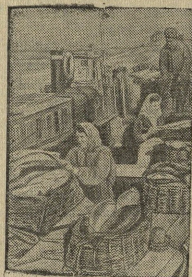
Dono kolektyvinio ūkio prieplauka.