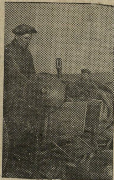
Leningrado srities, Kiungieppo MTS-e

LKP(b) Kupiškio mieste vykdo k-to pirm. org. sekretorius