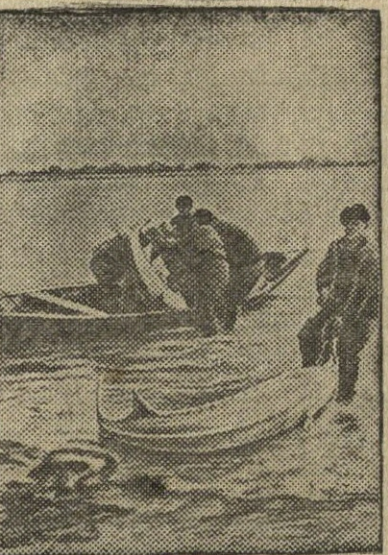
Žvejyba Azovo jūroje.