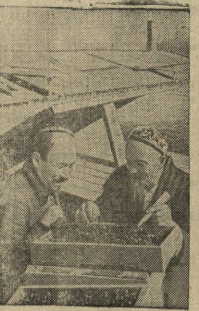
Uzbekijos TSR kolektyvininkai.

Kupiškio gimnazijos moksleiviai š. m. rugsėjo 1 d. susirinko į gimnazijos kiemą mitingui, skirtam mokslo metų pradžiai.