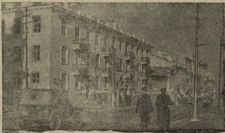
Sevastopolis. Atstatytas namas Lenino gatvėje.