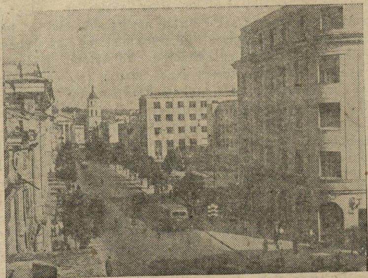
Diena iš dienos Tarybų Lietuvos sostinė vis labiau tvarkosi. Gatvėmis važinėja nauji automobiliai, lengvos automašinos. Vilnius apsidengė žalumynais.

Tai yra rimtas laidas laiku įvykdyti laišką draugui Staliniui prisiimtus įsipareigojimus — prieš laiką atsiskaityti su valstybe grūdų ir kitose žemės ūkio gaminių paruošose.