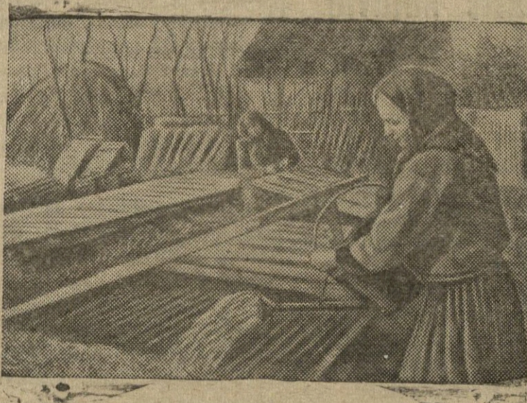
Vinicos sritis. Kryžopolso rajono, kolektyvinio ūkio „Trietij ūdornik“ sodo šiltadaržyje.