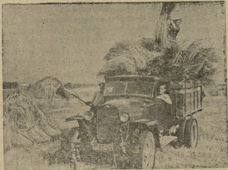
„Naujojo gyvenimo“ kolektyvinį ūkį (Marijampolės apskritis) šefuoja Lietuvos KP(b) Marijampolės apskrities komiteto kolektyvas. Padėti valyti derlių į kolektyvinį ūkį atvyko bendradarbių brigada. Per dieną sunkvežimiu buvo suvežta į klojimą keli tūkstančiai pėdų javų.

Nuotraukoje: „Naujojo gyvenimo“ kolektyvinio ūkio laukuose.