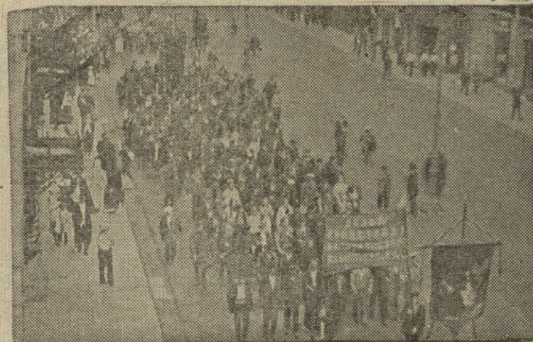
Petrogrado darbo žmonių demonstracija.