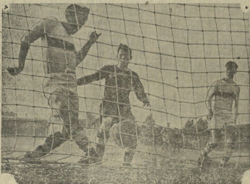
Praūzus Didžiajam Tarybų Sąjungos Tėvynės karui vėl atgijo Tarybų Lietuvos sportinis gyvenimas. Atstatyti ir statomi nauji stadionai, sporto aikštės, sudaryta visa eilė sporto klubų ir draugijų, išaugo nemaža sportininkų armija.