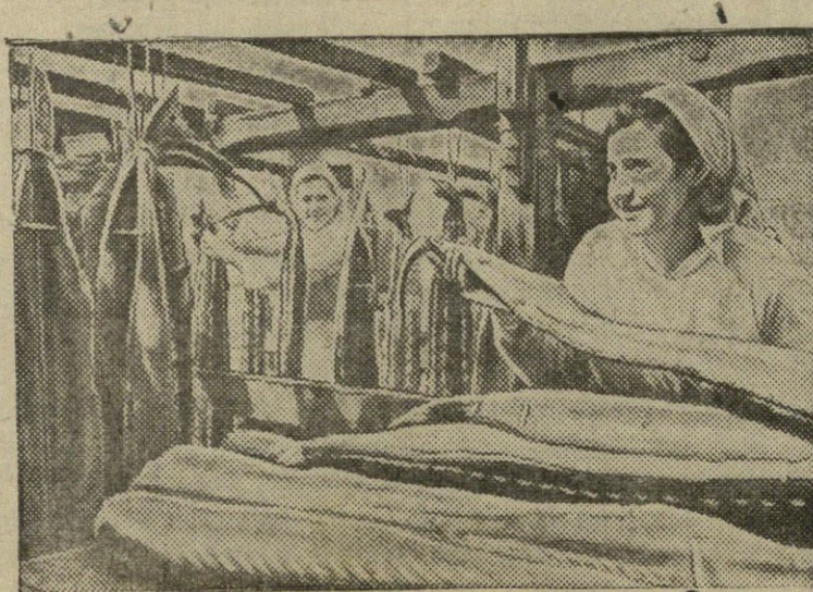
Odesos žuvies gamykloje,