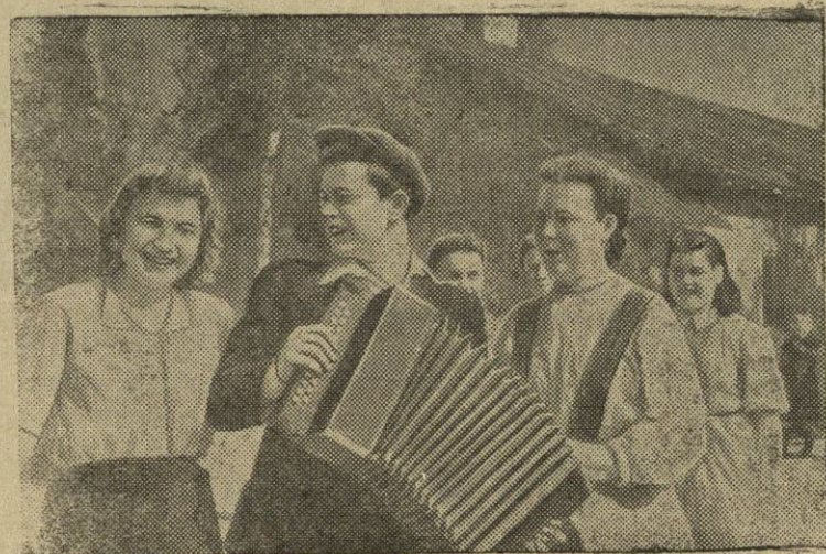
Leningrado sritis. „Iranovskos“ vardo durpyne komjaunuolių-jau-nuolių brigada gegužės mėn. darbo planą įvykdė 147 proc. ir uži-ma pirmą vietą įmonėje.