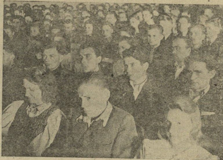
1948 m. liepos 2 — 4 dienomis Vilniuje įvyko Lietuvos komjaunimo IV suvažiavimas.

Visų valsčių partinės bei tarybinės organizacijos, pieninių bei pieno priėmimo punktų vedėjai, paruošų agentai turi imtis energingo darbo pieno paruošų įvykdyme, nes tik taip dirbant bus galima susilaukti gerų rezultatų. Valsčių ir apylinkių vykdomųjų komitetų Tarybų deputatų pareiga griežtai kovoti su buožėmis, kurie dar mėgina sabotuoti, nes tik palaužus buožių sabotazą ir įvedus griežtą kontrolę paruošų agentų darbe, apskritis pieno paruošų vykdyme stos į reikiamą vietą respublikoje ir tuo ištesėsime duotąjį žodį drg. Stalinui.