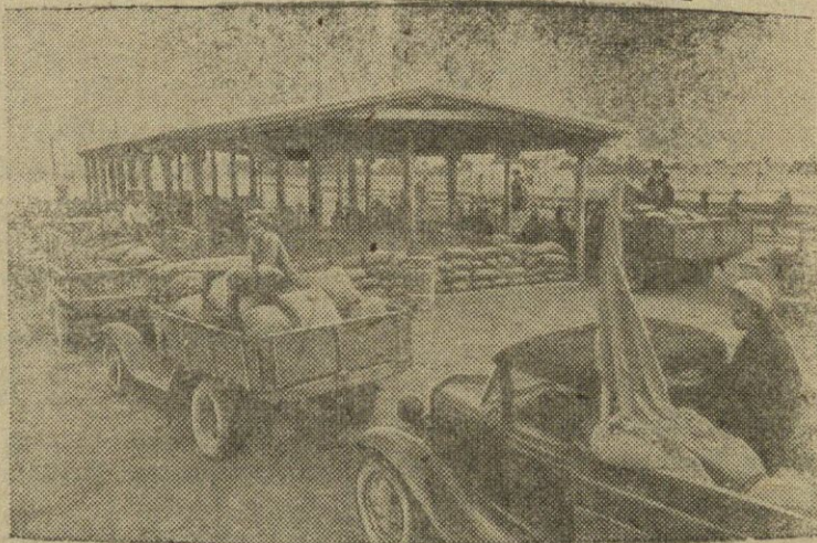
Turkmenijos TSR. Nepertraukiama srove eina naujojo derliaus duona į valstybinius grūdų sandėlius. Daugiau kaip 20 Geok-Tepinskovo rajono kolektyvinių ūkių susiorganizavo į stambų karavaną su grūdais. Nuotraukoje: automašinų kolona su naujojo derliaus grūdais paruošų punkte.