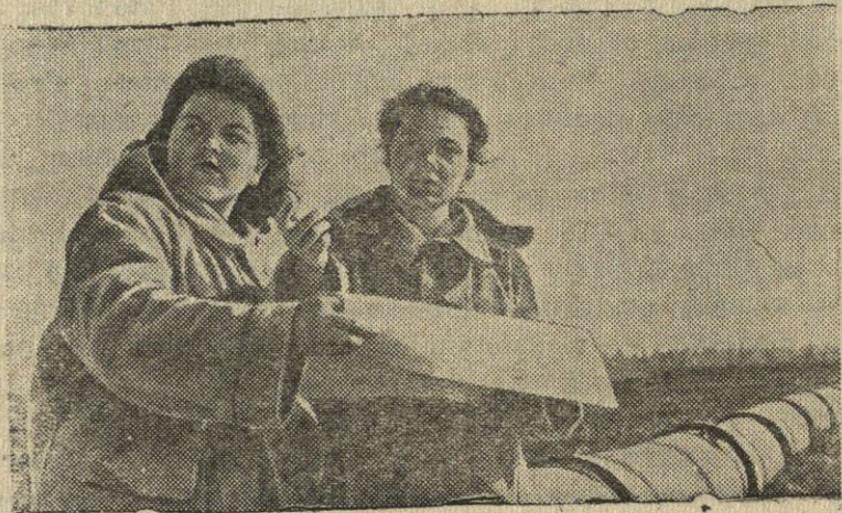
Leningrado sritis. Irininsko durpyne atlieka gamybinę praktiką Maskvos dur- pinio instituto IV-jo kurso studentai.

Šiuo metu studentai išdirba vamzdžių pravedimo išdėstymo schemą dėl van- dens išlaistymo į naujus plotus.