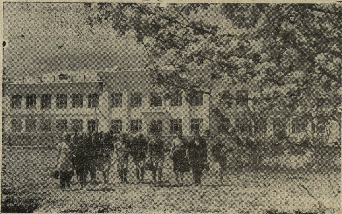
Pas mus atėjo žydinti gegužė