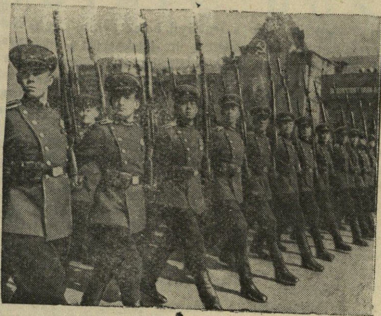
Maskvos karo mokyklų kursantai Gegužės Pirmosios parade Raudonojoje aikštėje.