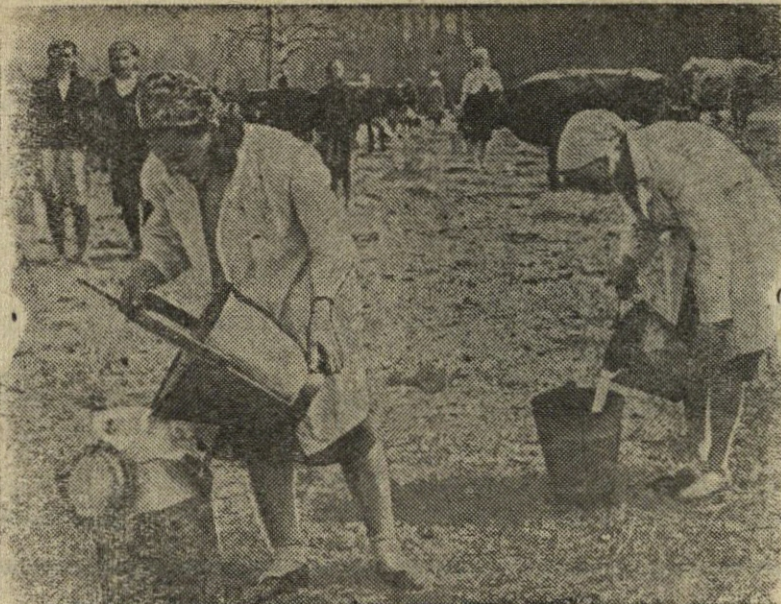
Pietiniuose mūsų plačiosios šalies rajonuose gyvulininkystės kolektyviniuose ūkiuose karvių bandos jau seniai ganosi ganyklose.

Nuotraukoje: Kolektyvinio ūkio melžėjos melžia karvės