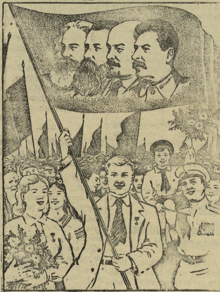
Po partijos vėliava, pirmyn į naujus laimėjimus!