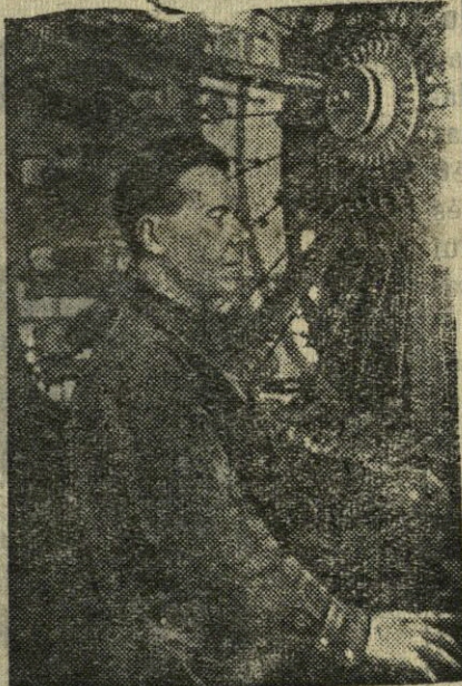
Minsko avalynės fabrike