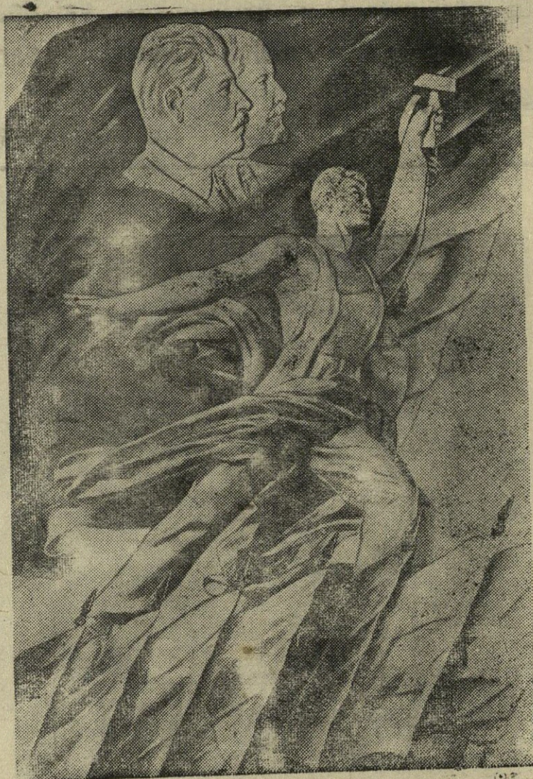
Už taiką, už liaudies demokratiją!

Uždavinys įvydyti penkmetį per 4 metus reikalauja nuolat ne tik įvykdyti visus