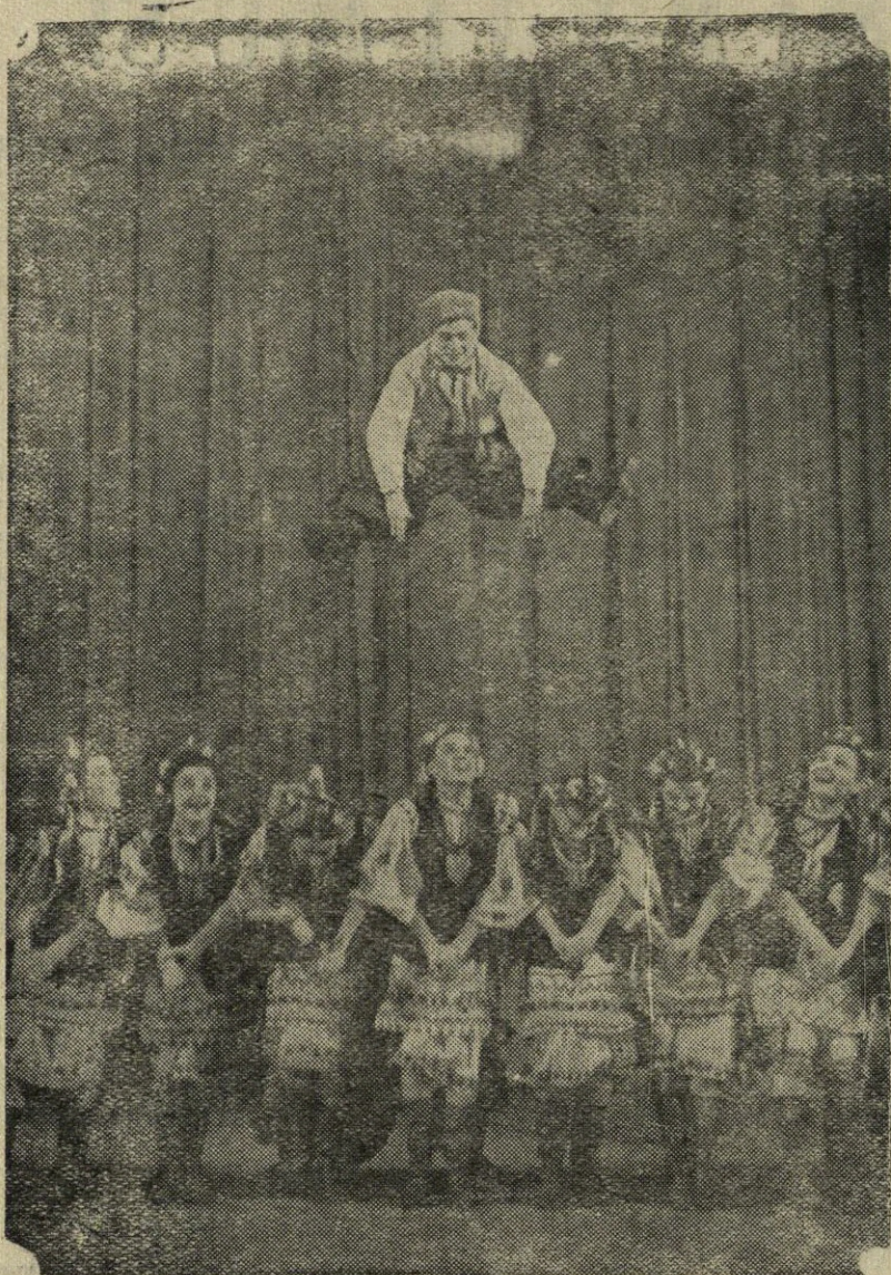
Hopakas. Išpildo TSRS Valstybinio liaudies šokių ansamblio artistai (meninis vadovas Igoris Moisejevas).