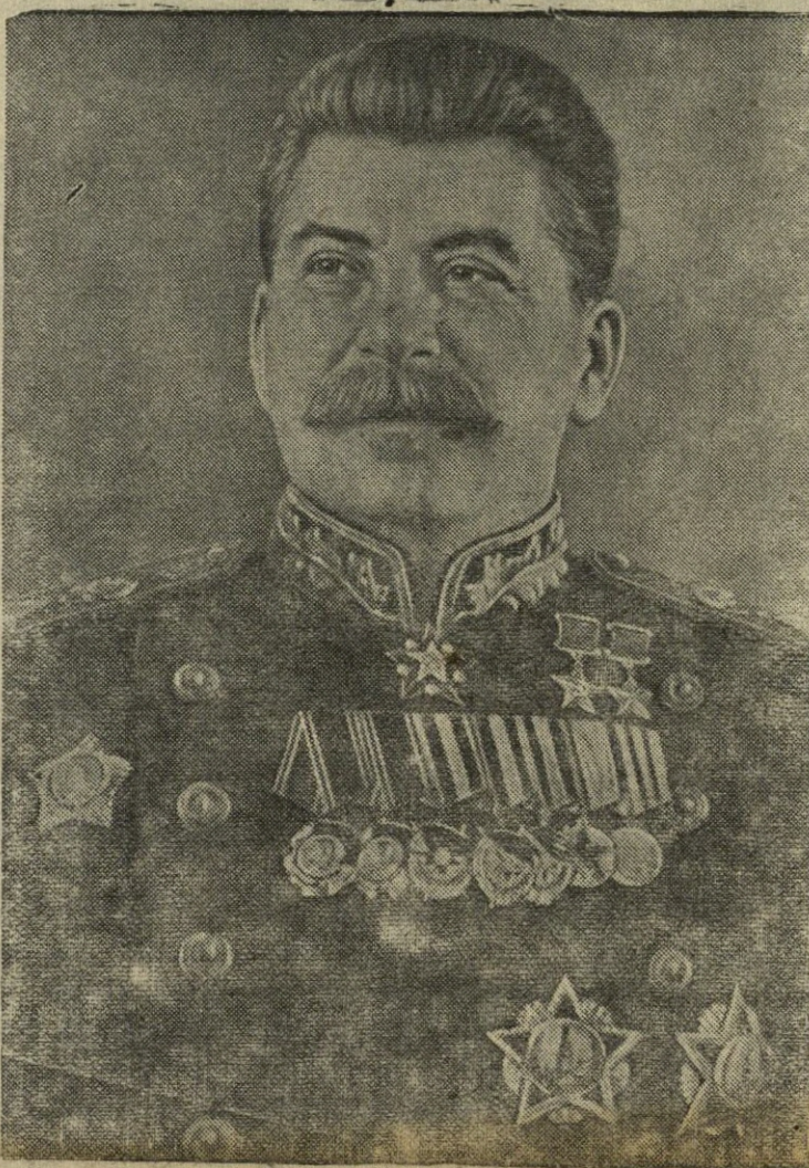
Tarybų Sąjungos darbo žmonių vadas ir mokytojas Didysis Stalinas

(Iš VKP(b) CK šūkių 1948 metų Gegužės Pirmąją)