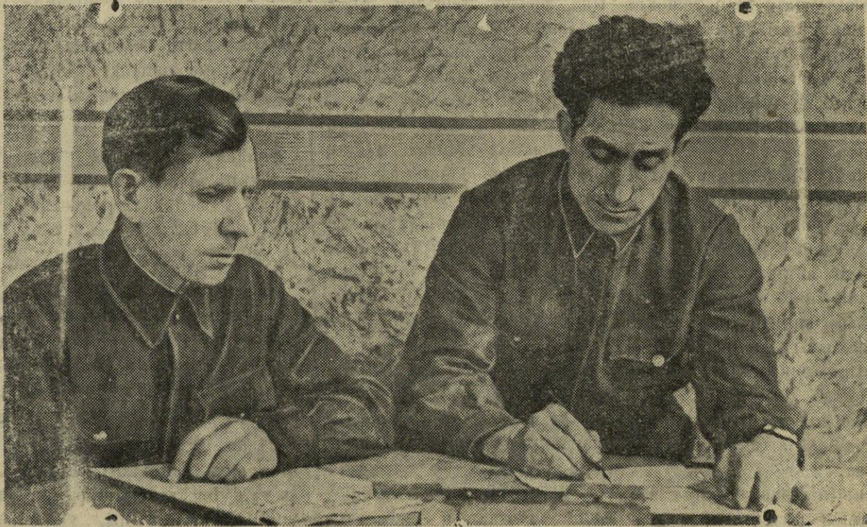
Prie savo miesto atstatymo projekto