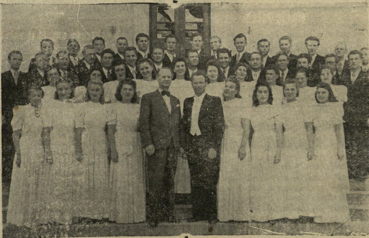
Tik prie tarybų valdžios tegalima vystyti lietuvišką kultūrą — tautinę pagal formą, socialistinę pagal turinį. Nuotraukoje: mišriųjų balsų choras