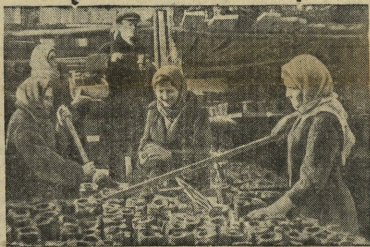
Tarybinio ūkio „Piervomaiskij“ daržininkystės cechas (Maskvos srities, Kalinino rajonas) užimtas įvairių maistinių daržovių, kaip kopūstų, pamidorų ir kitų daržovių kultūrų rasodos paruošimu.