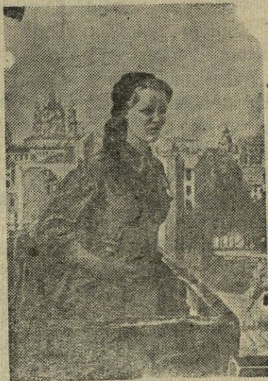
Didžiojo Tėvynės karo metais Vilniaus jaunimas kovojo prieš okupantus. Paveiksle: mergaitė — partizanė stebi hitlerininkų judėjimą.

Nors ir krito kovoje didvyris — Idealas jo mums taip brangus. Niekuomet neužmirš jo tėvynė Ir tarybinis laisvas žmogus.