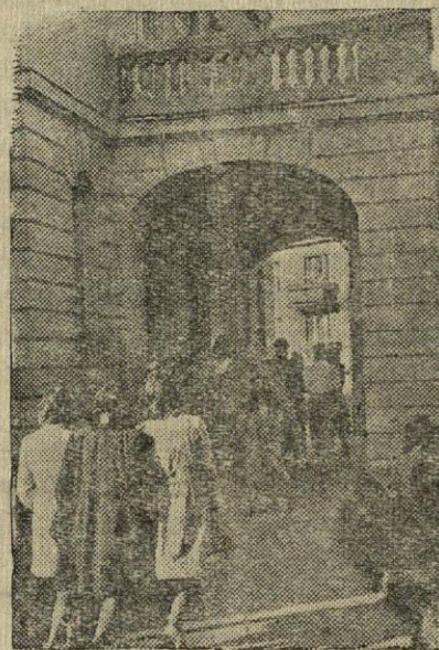
Dabar LTSR sostinėje taikūs metai. Vienoje iš Vilniaus gatvių. Jaunimas eina į kinoteatrą, kad kultū- ringai praleisti laisvalaikį.