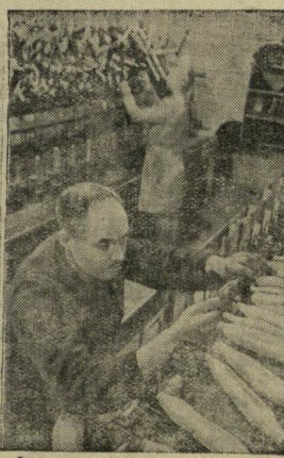
Vilniaus trikotažo fabrike „Sparta“