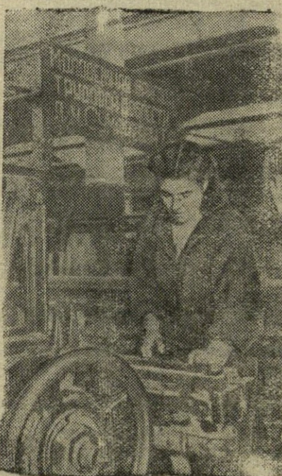
Kostromos linų kombinate