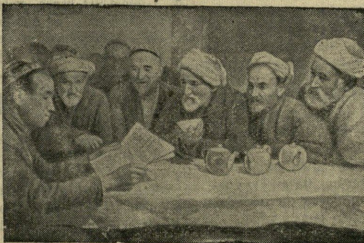
Seneliai klausosi agitatoriaus pasakojimų