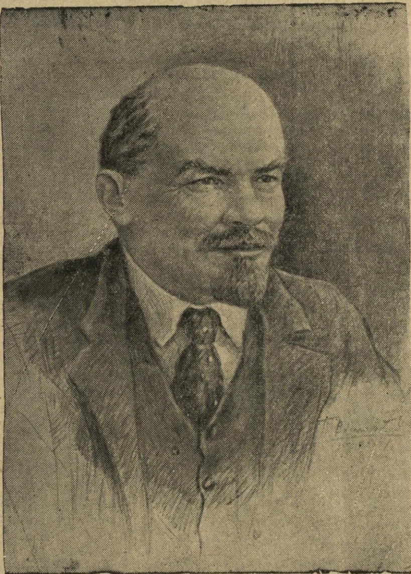
V. I. LENINAS