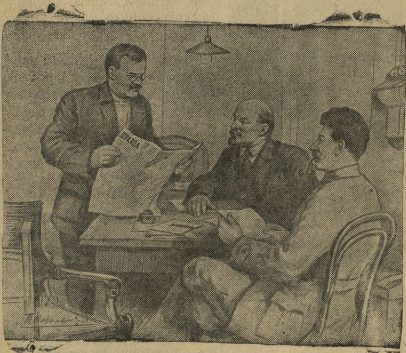
V. I. Leninas, J. V. Stalinas ir V. M. Molotovas „Pravdos“ redakcijoje

buvo sukurta stambi šiuolaikinė socialistinė pramonė. Tarybiniai valstiečiai, susivieniję į kolektyvinius ūkius, galutinai stojo į socializmo kelią. Išnaudotojų klasės tiek mieste, tiek ir kaime buvo likviduotos.