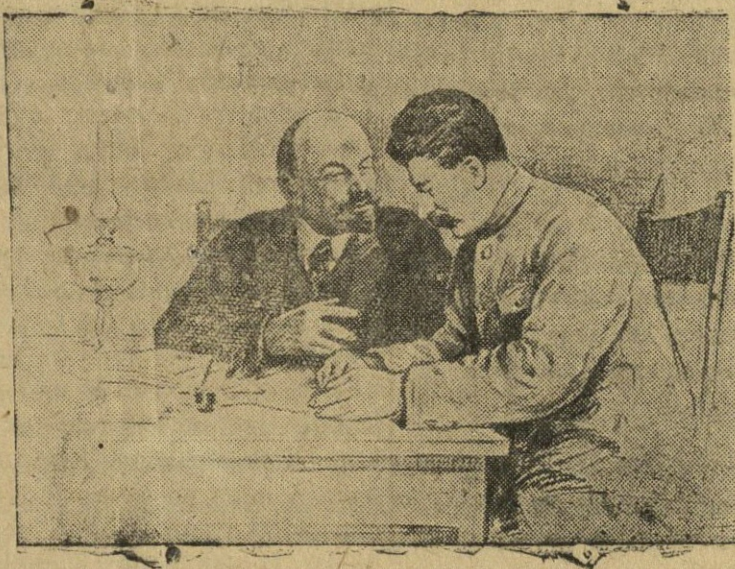
V. I. Leninas ir J. V. Stalinas pasitarime

Gyventi ir dirbti kaip Iljičius! Taip gyvena ir dirba mūsų vadas ir mokytojas Josifas Visarionovičius Stalinas, taip turi siekti gyventi ir dirbti kiekvienas iš mūsų.