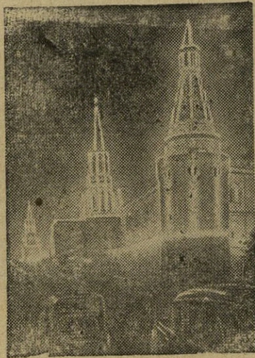
Maskvoje 800-tųjų metų minėjimas 1947 metų rugsėjo 7 d. Kremliaus iluminacija.