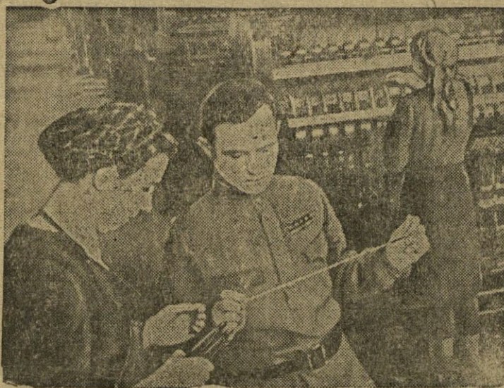
Briansko sritis. Klincovo siūlų fabrikas, sunaikintas vokiškųjų grobikų, atstatoma nauju techniniu pagrindu. Vienas jo skyrius aprūpintas vaterinėmis mašinomis, vietoje sulfaktorių. Žymiai padidintas staklių skaičius audimo ceche.

30-sioms Spalio metinėms fabriko kolektyvas prisėmė įsipareigojimą duoti virš plano daug gamybinės produkcijos.