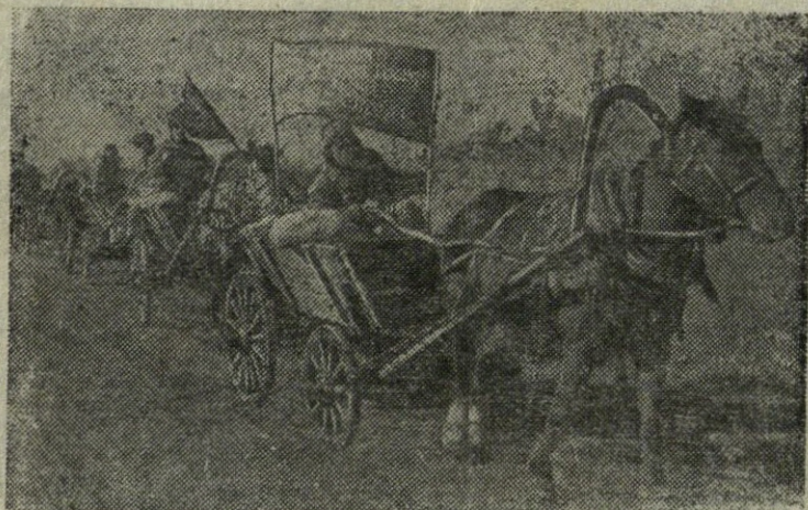
Atsakydami į altajiečių kolektyvininkų šaukimą Kuibiševo srities, Molotovo rajono žemės ūkio artelė „Valstiečio kelias“ įsipareigojo duoti virš plano valstybei 1.200 pūdų grūdų. Nuotraukos: kolektyvinis ūkis veža duoną atidavimui virš plano valstybei.