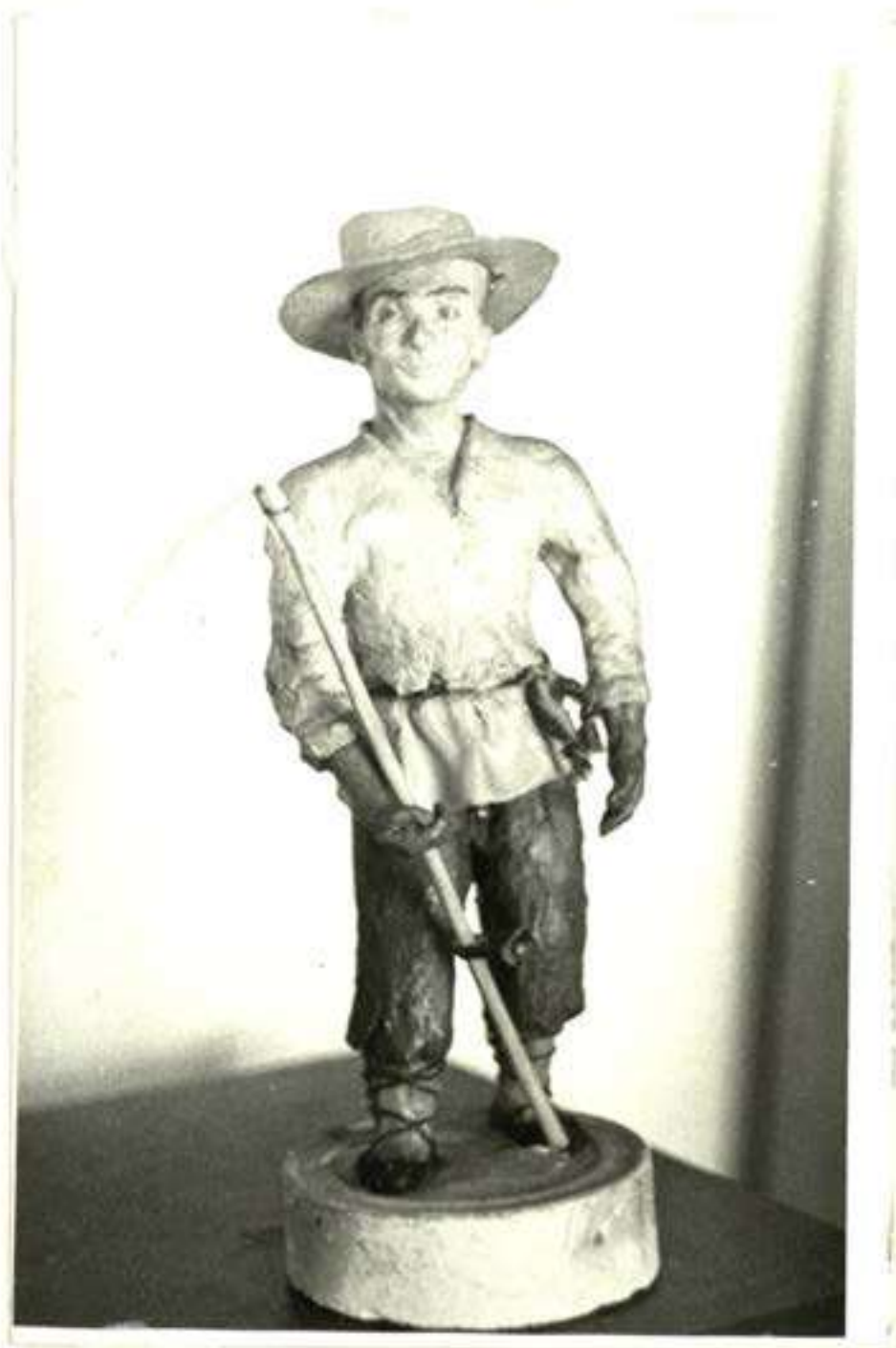
26 pav. Fiovėjas (Muziejaus eksponatas) /foto S. Matulevičiaus 1981 m. Negatyvas pas autorių/.

I. Franckevičius turėjo savo dirbtuvėlę metalo dirbiniams apdirbti, kaldavo papuošalus bei kitus apdailos darbus. Ailial iš metalo jo padarytą dalį matome šienpišvio rankoje nuotrauka pav. Nr. 26