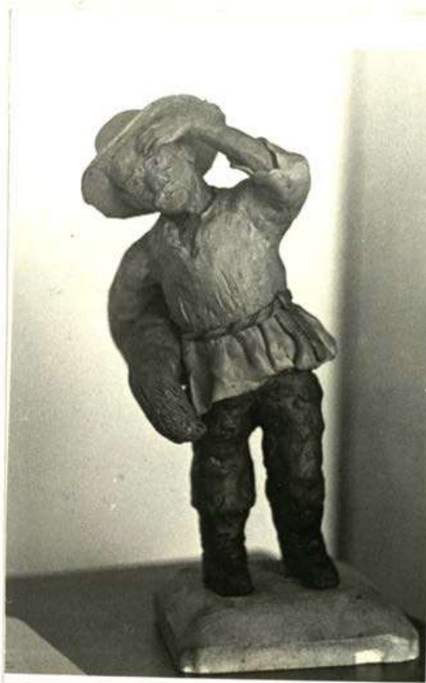
29 pav. Valstietis su javų pėda. (Muziejaus eksponatas) / Foto S. Matulevičiaus 1981 m. Negatyvas pas autorį/

Pats remontuodavo kroenis ir tas darbas jam sekėsi gerai.