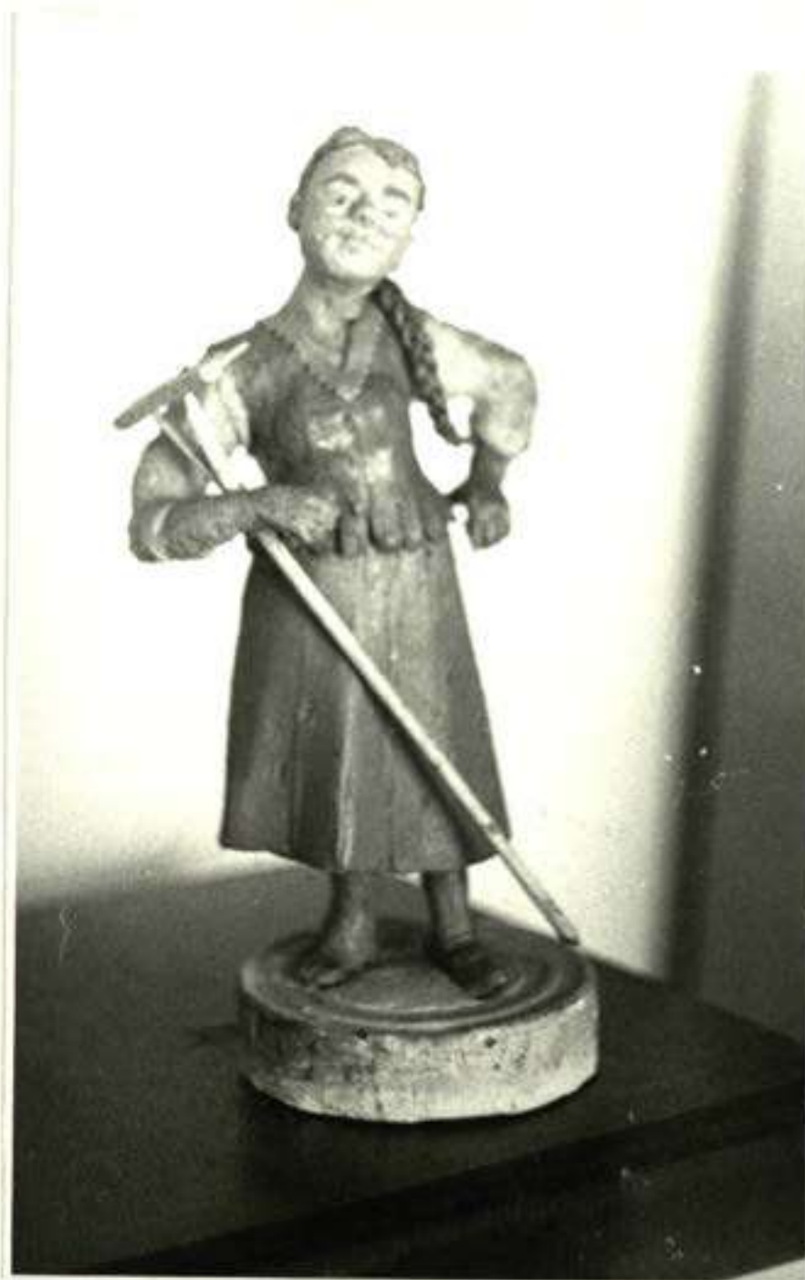
28 pav. Grėbėjas. (Muziejaus eksponatas)

Mokėjo dirbti įvairius medžio darbus. Jo padarytą miniatiūrinį grėblį matome grėbėjo rankose pav. Nr.27