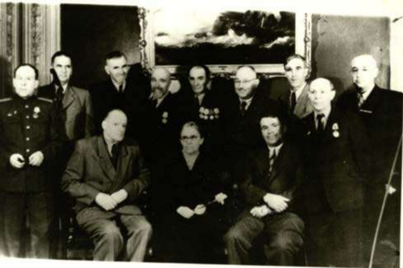
4 pav. Susitikimo dalyviai Maskvoje 1953m.