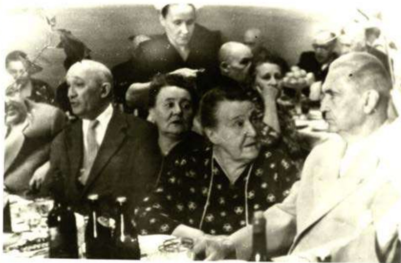
6 pav. Susitikimo dalyviai Maskvoje 1963 m.