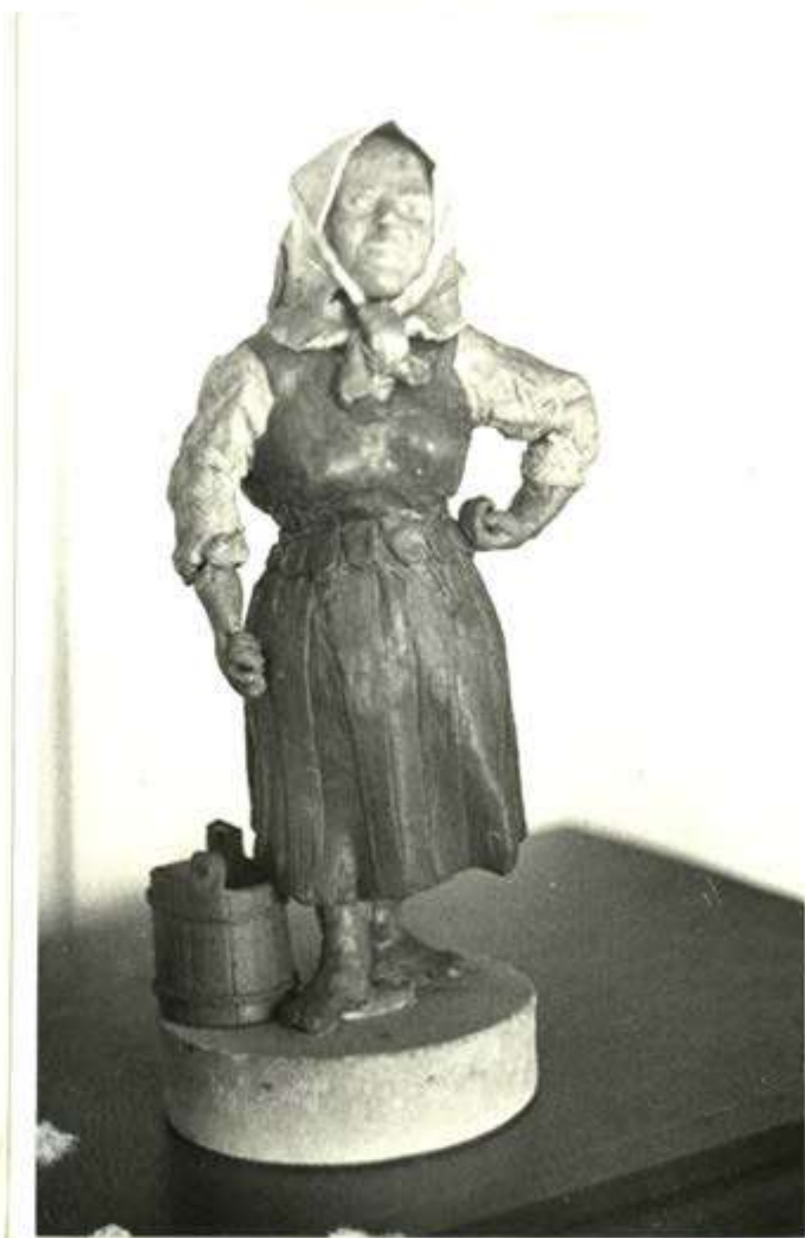
26 pav. Auštraukoje L. Franckevičiaus lipdinyje iš plastelino "landens nešėja" (Kupiškio muziejaus eksponatas) / Foto S. Matulevičiaus 1981 m. Regatyvas pas autorių/.

Gaila, kad maža tėra išlikusių jo darbų. Šiuo metu Kupiškio kraštotyros muziejuje yra keturi lipdiniai iš spalvoto plastelino.