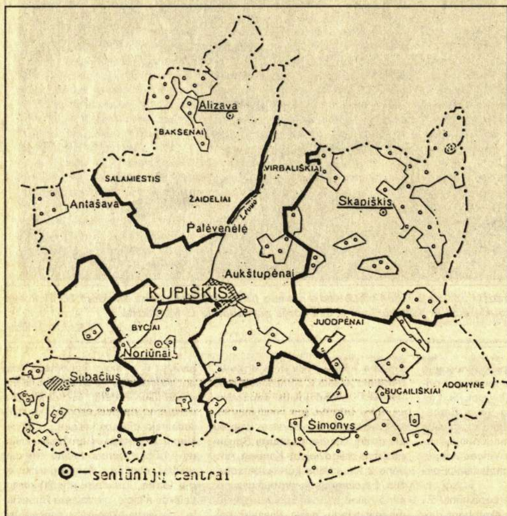
DABARTINĖS SENIŪNIJŲ RIBOS.