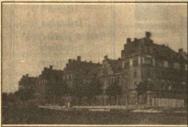
Klaipėdos kareivinės, kuriose gyveno 6-ojo pėstininkų pulko kariai.