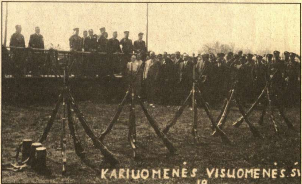
Šventės tribūnoje - 6-ojo pulko ir šaulių būrio vadai bei svečiai.