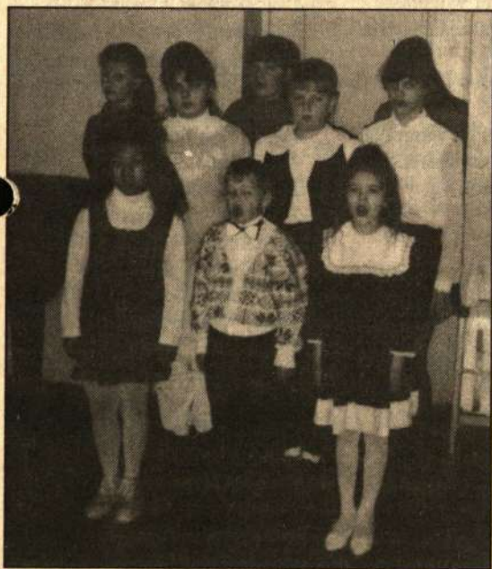
■ Dainuoja Subačiaus vidurinės mokyklos maežie dainorėliai.