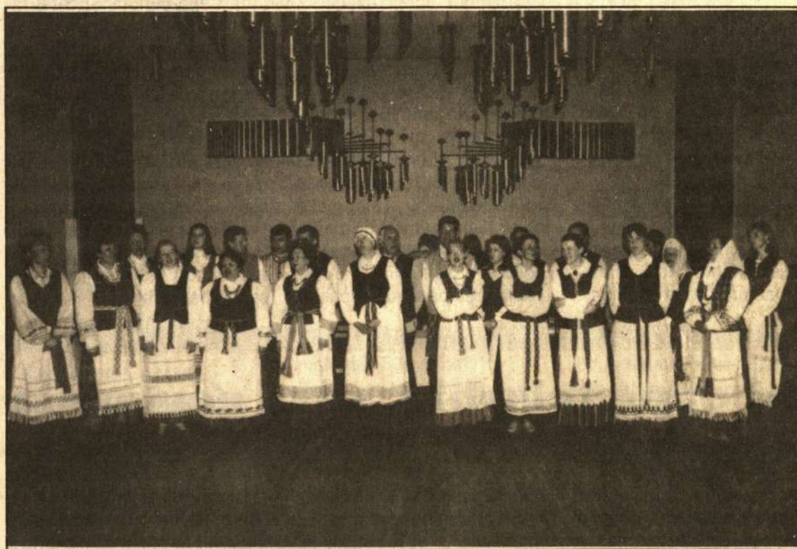
Nuotraukoje: dainuoja "Kupkėmis"

Po to visi norintieji linksminosi vakaronėje. "Atgailos" inf.