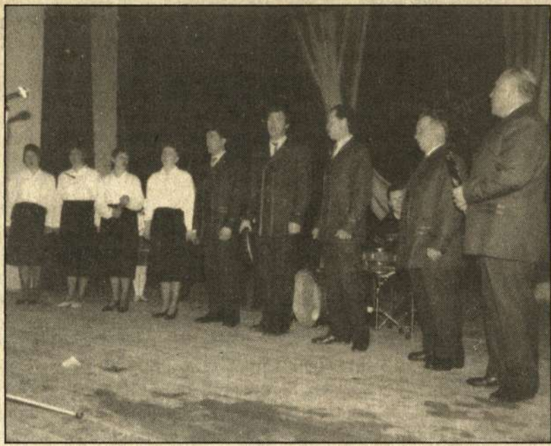
Koncertuoja Salamiesčio saviveiklininkai.