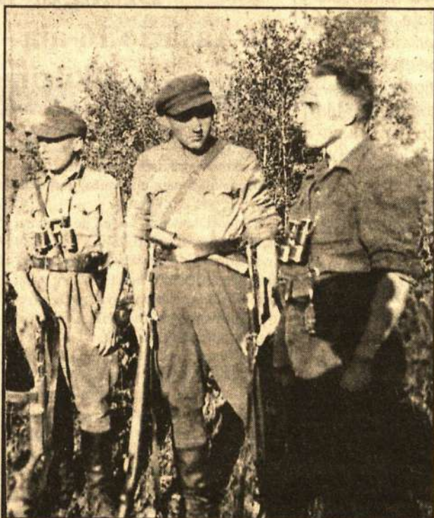
Nuotraukose: "Algimanto" apygardos partizanai.