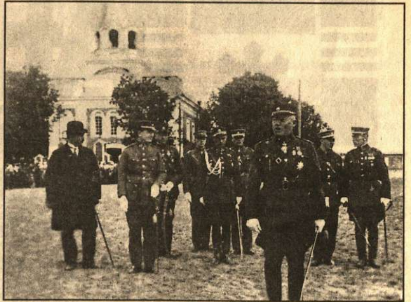
Minint Lietuvos kariuomenės dieną Panevėžyje, karius pasveikino Prezidentas A. Smetona (pirmas iš kairės).