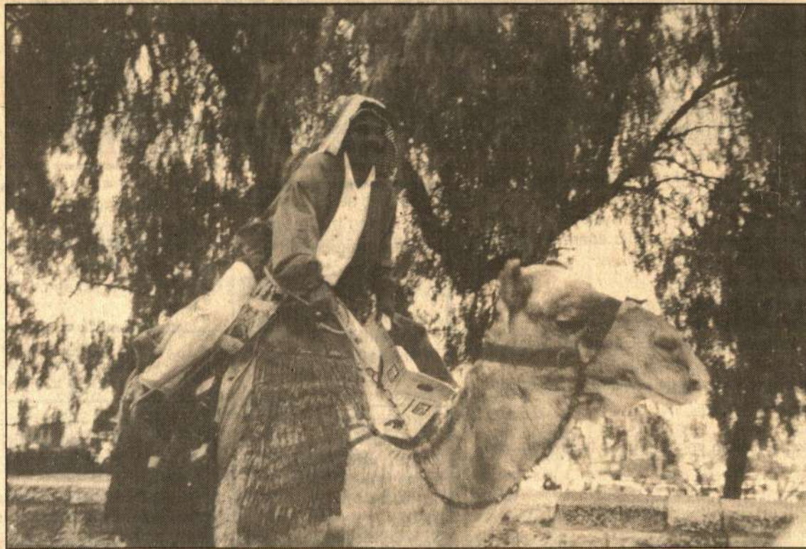
□ Vietos gyventojas arabas ant kupranugario.