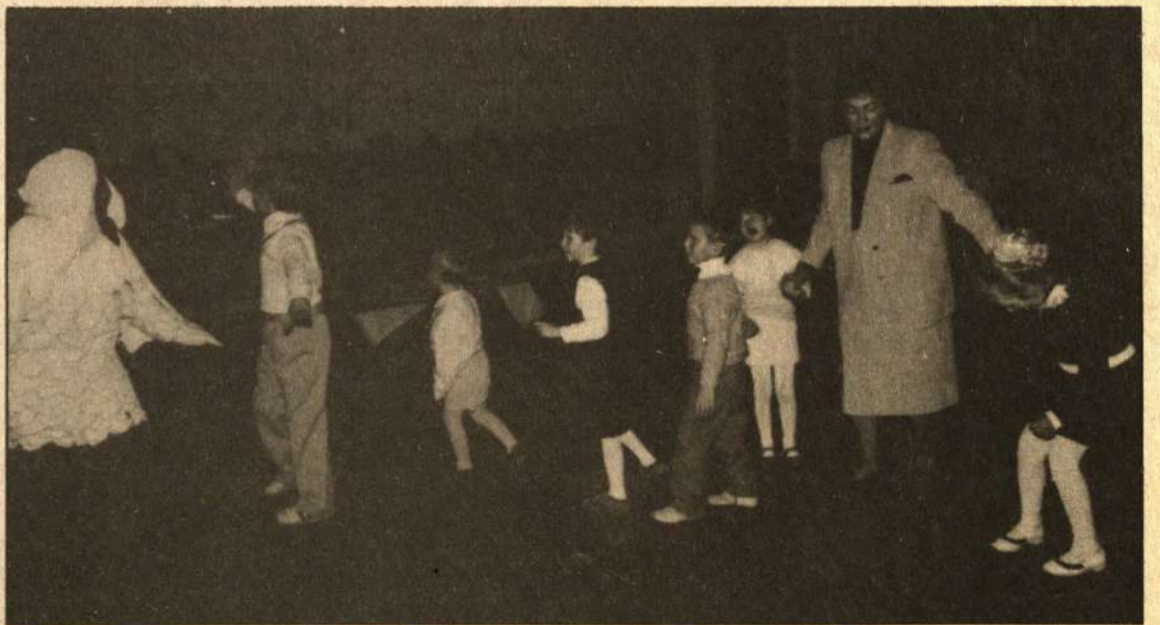
Praejusią metų pabaigoje į Kupiškio miesto kultūros namus buvo susirinkę sutrikusio intelekto žmonių globos bendrijos "Viltis" rajono skyriaus vaikai. Čia jie šoko, dainavo, vaidino. šios vakaronės fragmentas.