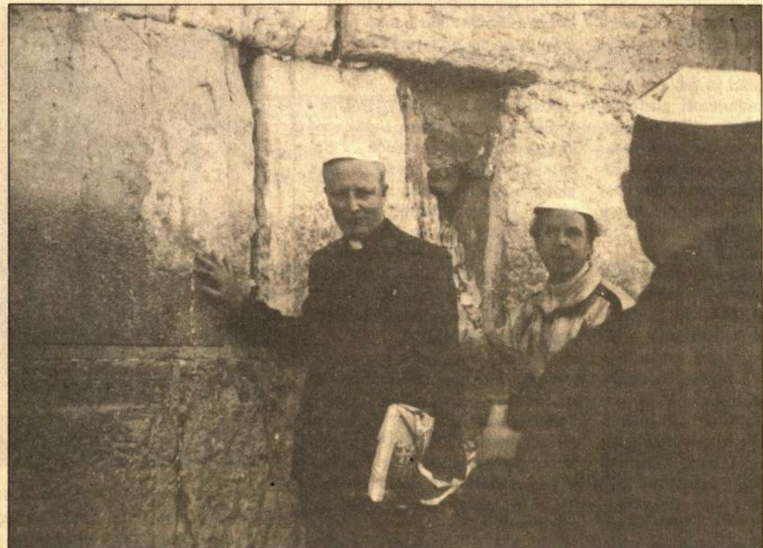
□ Prie Raudų sienos - likusi Galiamono šventyklos vakarinė dalis.