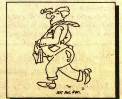
Piliečiai! Mes norime, kad būtų žmonių valdžia, o ne valdžios žmonės!