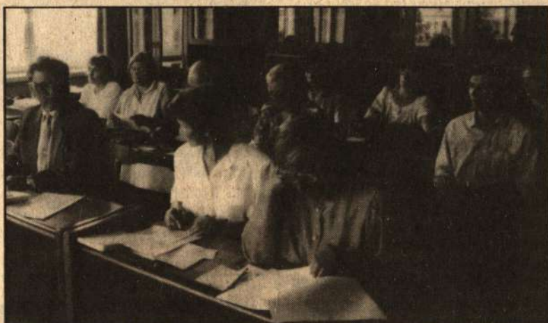
Apylinkių komisijų pirmininkai susirinko į pirmąjį seminarą.