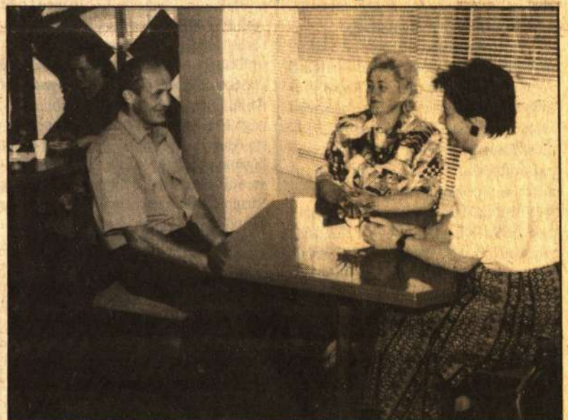
Parduotuvėje po remonto.