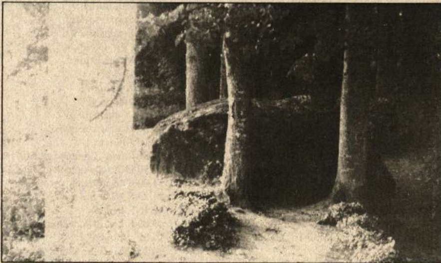
Gyvakarų akmuo su "velnio pėda" - valstybės saugomas gamtos paminklas.