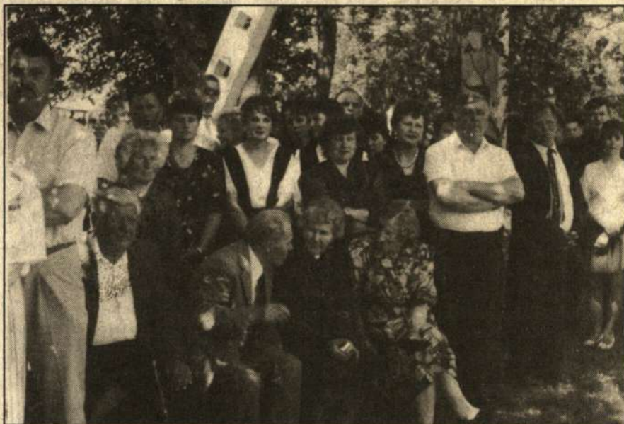
Mokyklos kieme grupė į iškilmes atvykusių jos auklėtinių ir svečių.