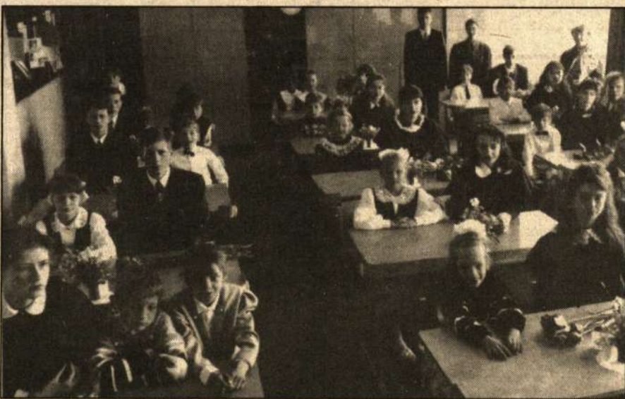
Grupė Kupiškio 2-osios vidurinės mokyklos abiturientų kartu su pirmokais paskutinio skambučio dieną.

Pastaba: Norėjome, kad ši mūsų kolektyvinė nuomonė būtų viešai pareikšta "Kupiškėnų mintyse", tačiau jų redaktorius A. Briedis mūsų laišką spausdinti atsisakė. Dėl to jį pateikiame "Atgaivos" laikraščiui.