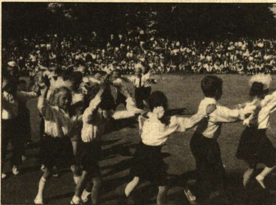
Šokių pynimėlis. Estradoje - Kupiškio miesto vaikų lopšelio-darželio "Saulutė" šokėjai.