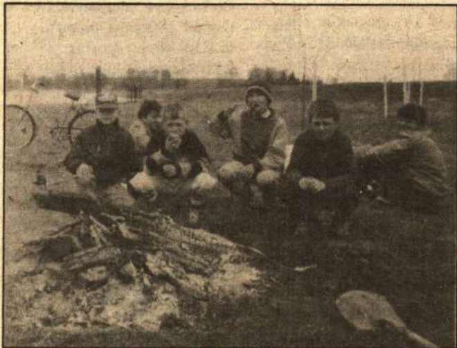
Užkandžiauja patys jauniausi konservatoriai.