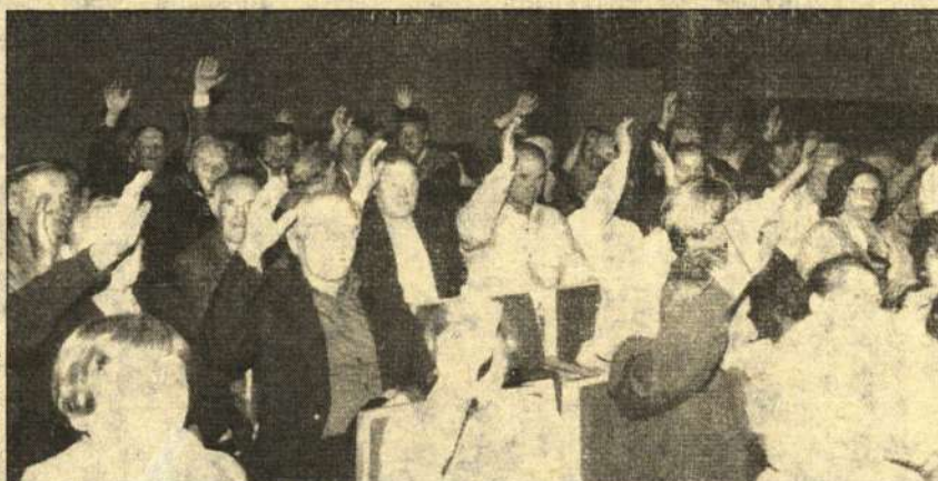
Juozo Kraujūno nuotr.