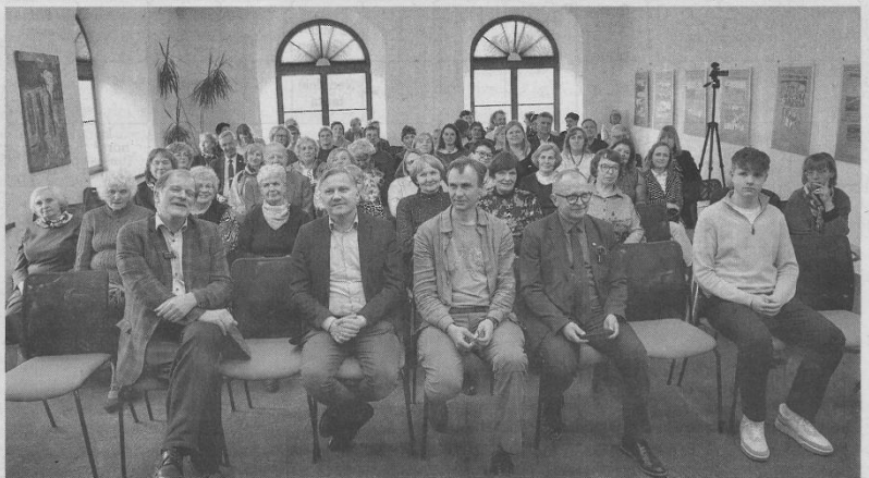
Konferencijos dalyviai su renginio svečiais.