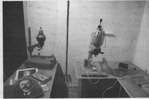
Analoginės fotografijos dirbtuvės laukia fotografijos mėgėjų.

mo sovietų okupaciniam režimui dalyvės, dirvožemininkės, mokslų daktarės Albinos Pajarskaitės atkurtas gyvenamasis kambarys ir čia eksponuojama jos biblioteka.