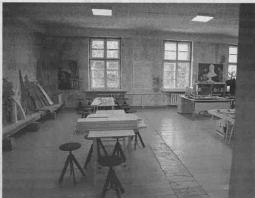
Skulptoriaus Jono Jagėlos memorialiniame kabinete įrengta edukacijų vieta.