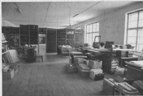
Sutvarkius šią patalpą čia persikels grafikos ir tapybos užsiėmimai.

Lankytojų čia lauks ir įdomus kampelis. Tai kraštiečių, Lietuvos katalikų vienuolės, pasipriešini-