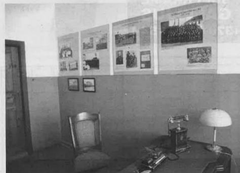
Kambario, skirto buvusių Kupiškio kareivinių istorijai, fragmentas.

A. Venckus vylėsi, kad ši vieta lankytojų bus mėgstama, kad čia nuolat virs kūrybinis gyvenimas. Į kūrybines veiklas kupiškėnai bus kviečiami ir pasibaigus minėtam