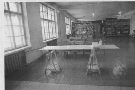
Parodų erdvė kareivinėse, Kupiškio viešosios bibliotekos padalinyje, laikinai bus skirta grafikos ir tapybos užsiėmimams.

projektui, juolab kad biblioteka tai darė ir anksčiau savo iniciatyva. Čia puiki vieta įgyvendinti ir įvairiems originaliems meniniams sumanymams, kuriems reikia didesnės erdvės.