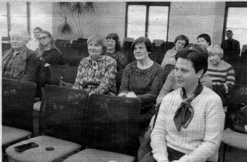
Susitikimo dalyviai.