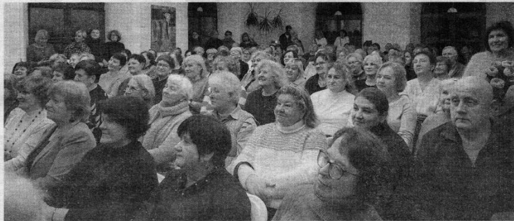
Susitikimo dalyviai netilpo bibliotekos konferencijų salėje. Dalis jų klausė renginio vaizdo transliaciją skaitykloje.