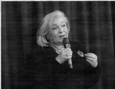
Edita Mildažytė auditorijoje atskleidė daug savo gyvenimo detalių ir papasakojo, kodėl tai ryžosi papasakoti knygoje.

Ji prisiminė ir Kauno atvejį, kai į salę, kurioje telpa truputį per 200 žmonių, netilpo dar 600 žmonių, atvykusių į susitikimą. Tai ji netilpusiems į susitikimą žmonėms parašė autografus ir pažadėjo atvažiuoti į dar vieną susitikimą. Bet ir