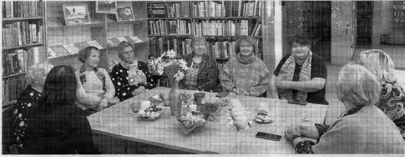
Skaitytojų klubo „Atgavios puslapiai“ pirmas susibūrimas Noriūnų bibliotekoje.

Per kalėdinių eglučių parko, veikusio Palėvenės vienuolyne, uždarymo renginį tarp puošusių eglutės buvo ir Kupiškio viešosios bibliotekos Noriūnų padalinio skaitytojų klubas „Atgavios puslapiai“.