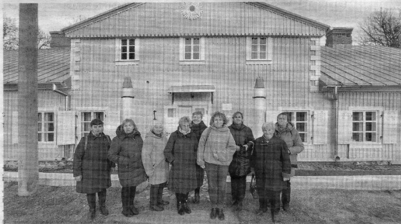
Skaitytojų klubo narės iš Antašavos, Juodpėnų, Noriūnų ir Šimonių susitiko Adomynės dvare.