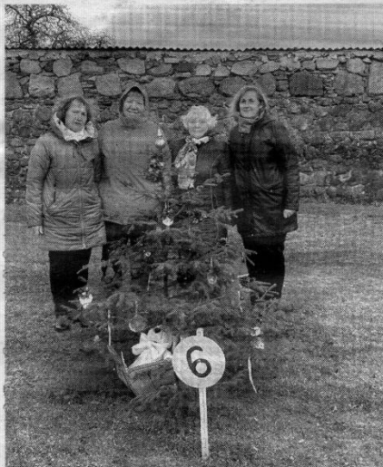
Skaitytojų klubo „Atgavios puslapiai“ narės prie pačių puoštos kalėdinės eglutės Palėvenės vienuolyne kieme.