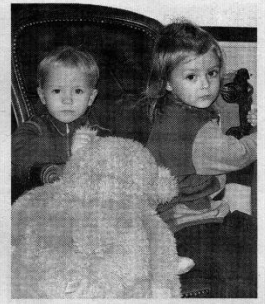
Mažieji keliautojai – Perkūnas ir Girė.