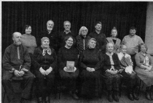
Knygos autorė su Kupiškio krašto ir atvykusiais iš Rokiškio, iš kitur sentikių bendruomenės atstovais.

Renginio vedėjos paklausa- ta apie knygos idėją, jos autorė sakė, kad pirminė idėja buvo šia