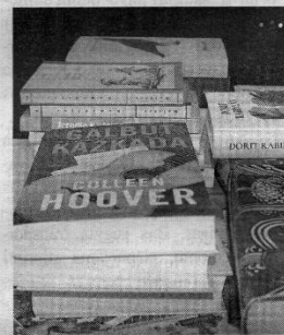
Bibliotekos fondus papildys puspenkto šimto dovanotų naujų knygų.