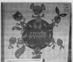
Parodos eksponatai.