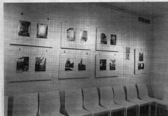
Kęstučio Skerio fotografijų parodos fragmentai.