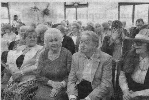
Susikaupimo prieš renginį akimirka.

Po knygos pristatymo šis jaukus susibūrimas tęsėsi toliau. Visi renginio dalyviai galėjo pabendrauti neformalioje aplinkoje prie vaišių stalo ir pasiklausyti retro muzikos iš vinilo plokštelių.