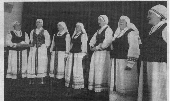
Per renginį sutartines giedojų Kupiškio kultūros centro sutartinių giedotojų grupė „Selija“.