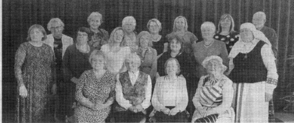
Tarmišką autorinės kūrąbos konkurse „Parašyta kupiškėniškai“ dalyvavo daugiau nei dvidešimt žmonių. Jų kūrinius vertino kompetentinga komisija, o rudenį planuojama visus kūrinius sudėti į knygą tokiu pat, kaip ir konkursas, pavadinimu.

sumanytojai – literatų klubas „Lėvens balsai“, kvietęs visus kupiškėnų tarmeį prijauciančius kraštiečius pateikti savo kūrąbą.