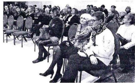
Renginio pradžios laukiant.