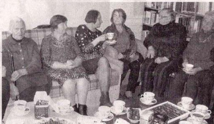
Į popietę prie arbatos puodelio susirinko nemažas būrys aktyvių kupiškėnų.

žiūrėjo Panevėžio Vytauto Mikalausko menų gimnazijos mokinių parodą „Liečiu, vadinasi, matau“. Tai liečiamieji darbai, padedantys neregiams pažinti pasaulį. Kartu tai ir galimybė reginčiajam užsimerkti, prisiliesti prie įvairių paviršių ir pabandyti suprasti, kaip jaučiasi neregys.