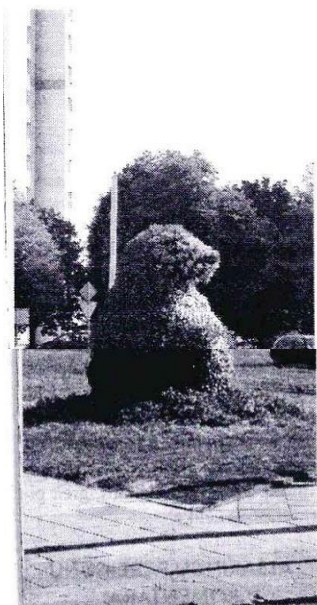
Zgiežo miesto simbolis sėkmingai naudojamas ir želdiniuose.